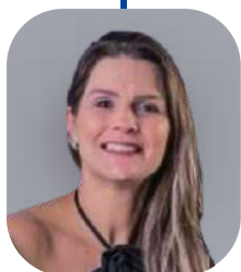
Joanna Rubim Assessoria e Consultoria Contábil